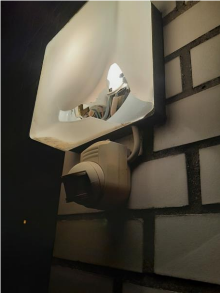
Schaubild 3: Nebeneingang