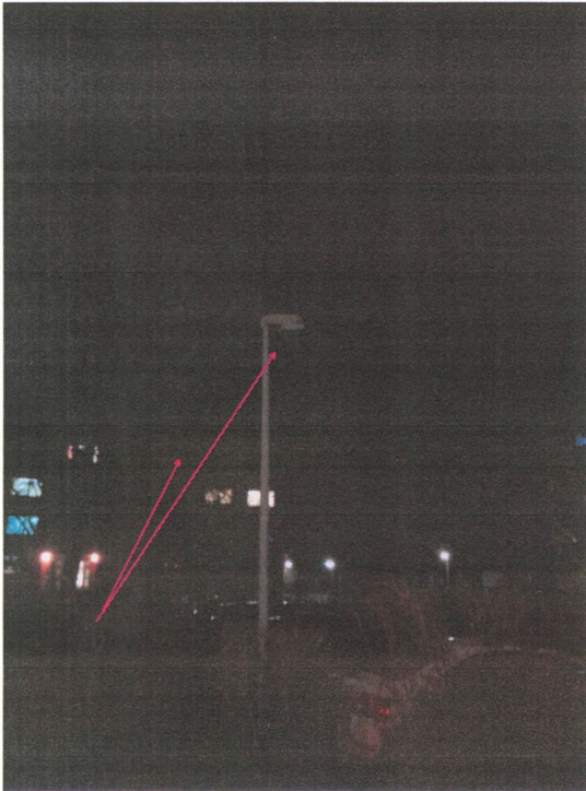
Schaubild 1: Parkplatz