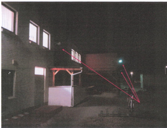
Schaubild 3: Hof/Ausrückbereich